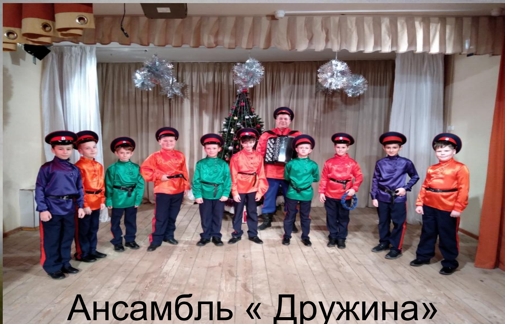
Ансамбль « Дружина» «Схотел турок воевать»